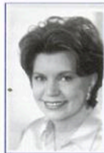
ELIZABETH CLARE PROPHET

Es mística, escritora, conferencista y maestra espiritual. Pero ante todo, una Mensajera de los Seres Espirituales Avanzados llamados Maestros Ascendidos. Ha publicado algunas de las más profundas y hermosas enseñanzas espirituales del mundo en más de setenta y cinco libros e impartido conferencias en Estados Unidos y en 28 países más. Su tema favorito es: La evolución del alma a través de una energía espiritual conocida como La Llama Violeta. Es especialista en Budismo, Cristianismo Místico, textos Cristianos gnósticos, Hinduismo, Kabbalah (Judaísmo místico) y Taoísmo.